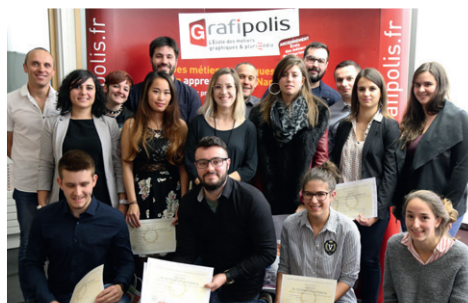
Lauréats BTS Communication et industries graphiques

Le 17 novembre dernier, tous les lauréats de la session 2017 étaient conviés à la traditionnelle remise des diplômes.