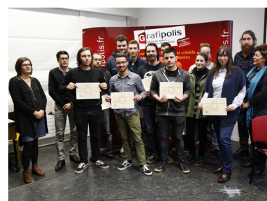
Lauréats des Bac Pro RPIP

Retrouvez toutes les photos de la soirée sur notre page Facebook !