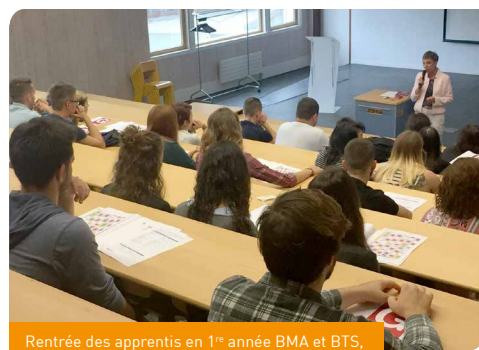
Rentrée des apprentis en 1 re année BMA et BTS, ainsi que des apprentis en première bac pro.