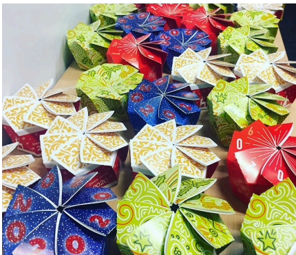
Exemple de boîtes réalisées en découpe typo.

Une présentation de l'accompagnement individualisé proposé aux apprentis et des actions éducatives a également été proposée à chaque groupe, de même qu'une visite des locaux.